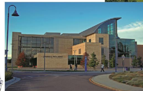
加州州立大學蒙特利灣分校 (California State University, Monterey Bay, CSUMB)